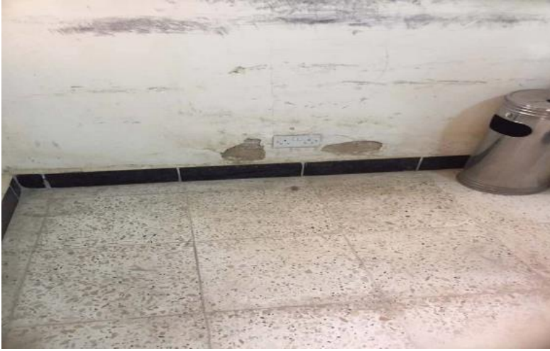
الشكل 3: الحالة الداخلية الحالية لعيادة المنصورية التجريبية