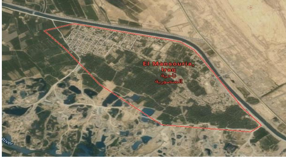
الشكل 1: خريطة جوجل صور للموقع العام للمشروع

تقع عيادة منصورية الجبل في منطقة ريفية بمحافظة ديالى بتنسيق 34 ° 4 ' 36 " N و 57 ° 44 ' 17 " E ، وهي منطقة عراقية تقع على بعد 110 كم شمال شرق بغداد في محافظة ديالى. ويبلغ عدد سكانها حوالي 59335. تكمن أهميته في الإنتاج الزراعي وموقعه على مسافة نصف المسافة بين نهر ديالى ونهر الخالص ، أكبر فرع لنهر ديالى.