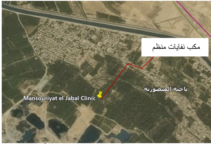
الشكل 5: استخدام الأرض حول عيادة منصورية الجبل

جميع البنية التحتية في جميع أنحاء العيادة متاحة والعيادة متصلة بشبكة إمدادات المياه المحلية ، وشبكة الكهرباء والمياه العادمة. سيتم استخدام موقع الإلقاء المنظم الذي يقع على بعد حوالي 600 متر من موقع المركز الصحي للتخلص من هدم / نفايات البناء (الشكل 3) ، بينما سيتم نقل النفايات الطبية إلى محرقة مستشفى الخالص كما هو مذكور في التفاصيل في تدابير التخفيف وفي خطة إدارة النفايات. سيتم تنسيق التخلص من النفايات مع مديرية بلدية ديالى ومع مديرية البيئة.