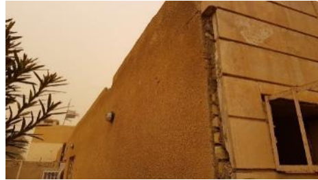
الشكل 2: صور توضح الحاجة إلى إعادة تأهيل عيادة منصورية الجبل