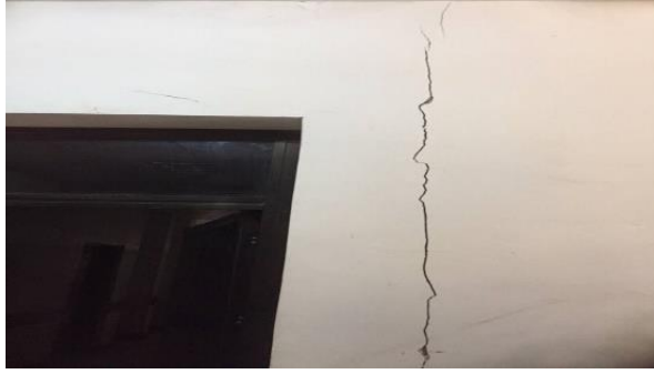
الشكل 3: صور توضح الحاجة إلى إعادة تأهيل عيادة شروين

وفقاً لاتفاقية العقد ، تكون مدة المشروع المتوقعة 150 يوماً.